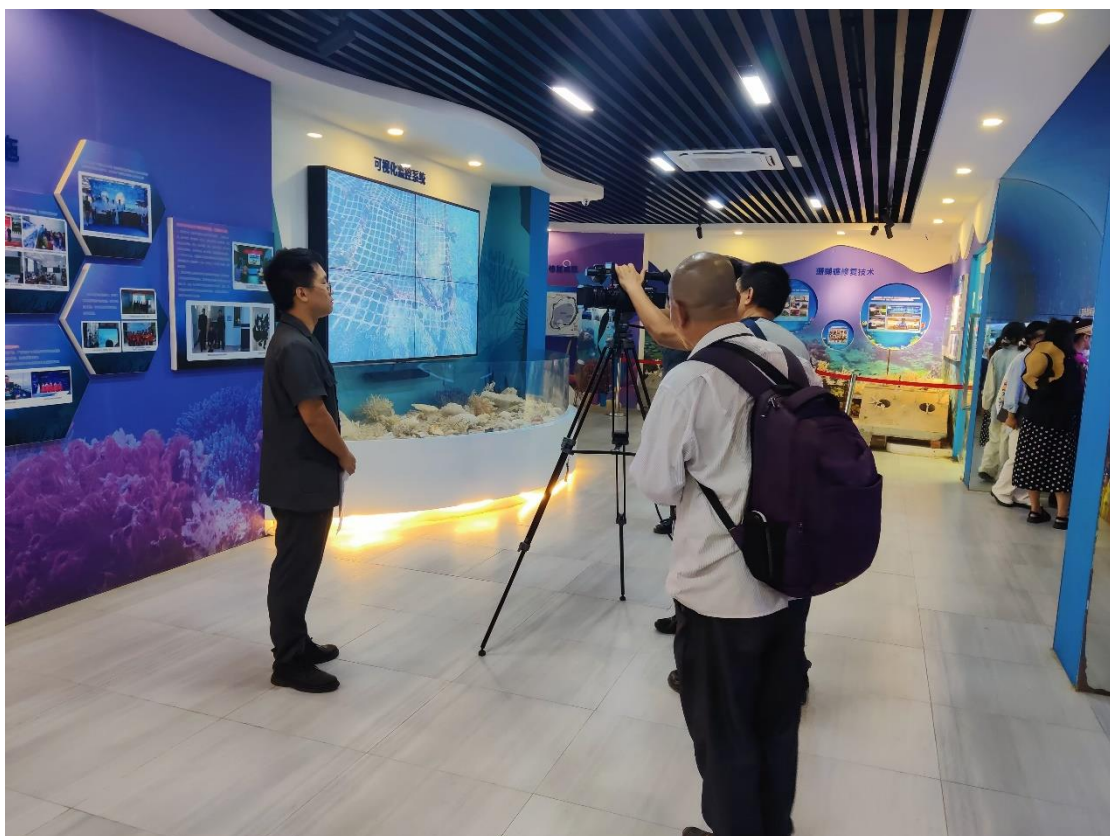
10月15日北海市海城区人民法院来馆拍摄普法宣传素材