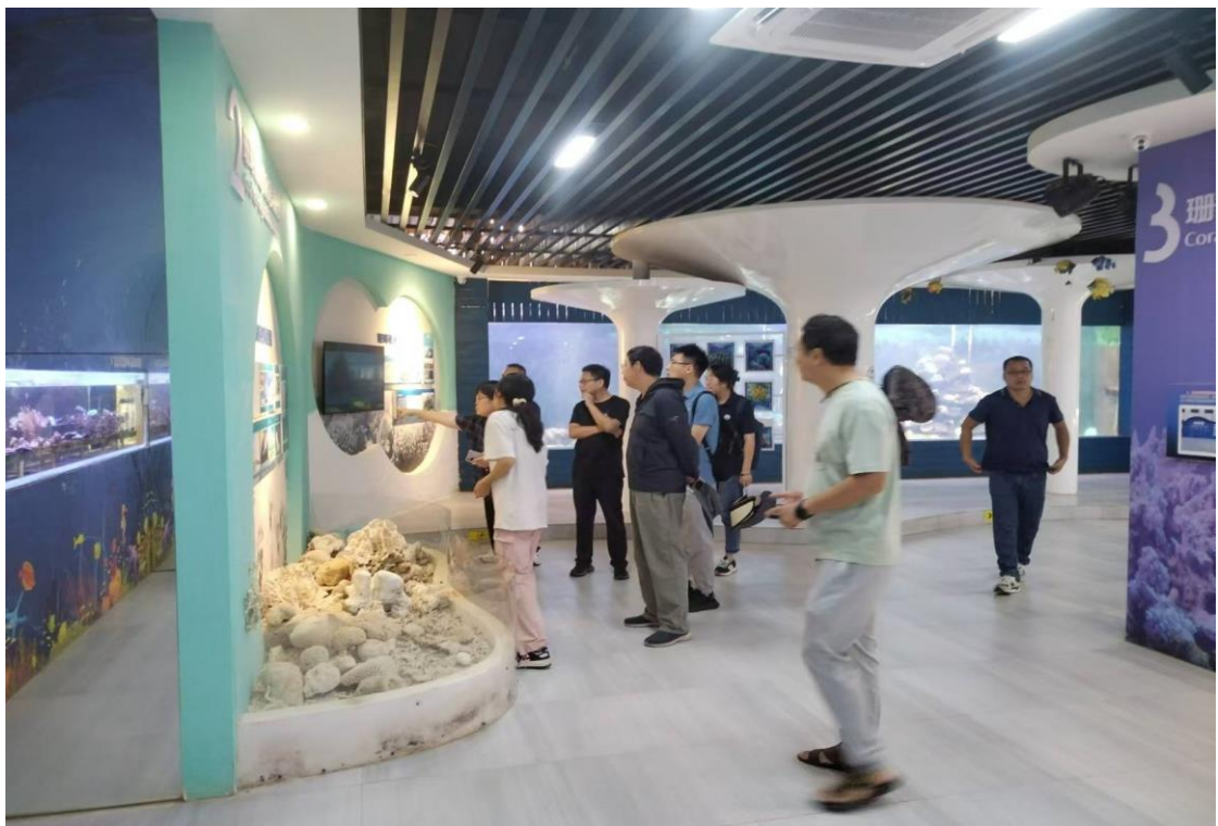
10月25日涠洲岛旅游区管理委员会一行来馆参观