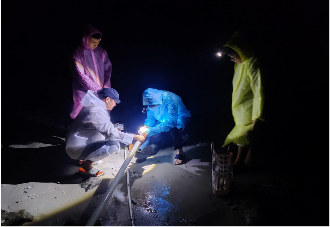
工作人员和驻岛学生在连夜抢修加固海底输水管道