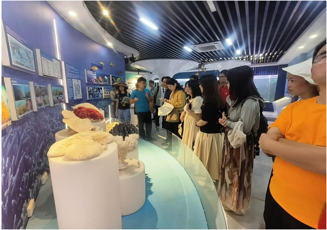
10月22日广西农村商业联合银行一行来馆参观