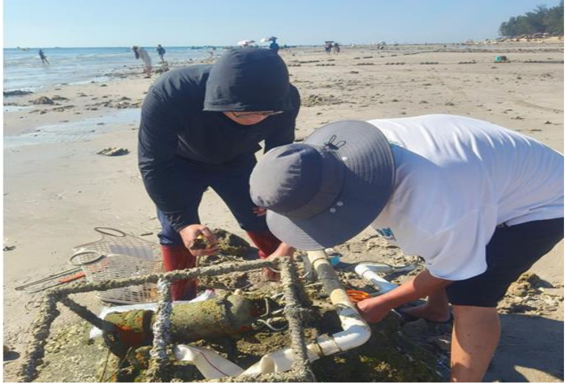
工作人员在更换加固海底潜水泵输水软管