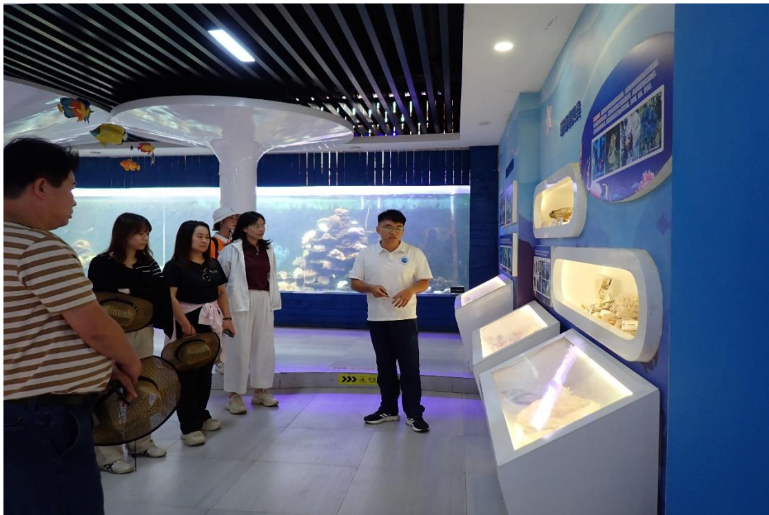
10月10日自治区文化和旅游厅领导参观调研

2024年10月，自治区文化和旅游厅、北海市国家安全局、北海市海城区人民法院、涠洲人民法庭、涠洲岛旅游区管理委员会、北海市涠洲岛新绎旅游投资开发有限公司、广西农村商业联合银行股份有限公司共7家单位参观珊瑚馆，并开展学术、科研、科普宣传交流工作。