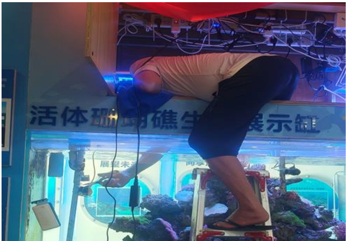
工作人员在更换中央缸造浪