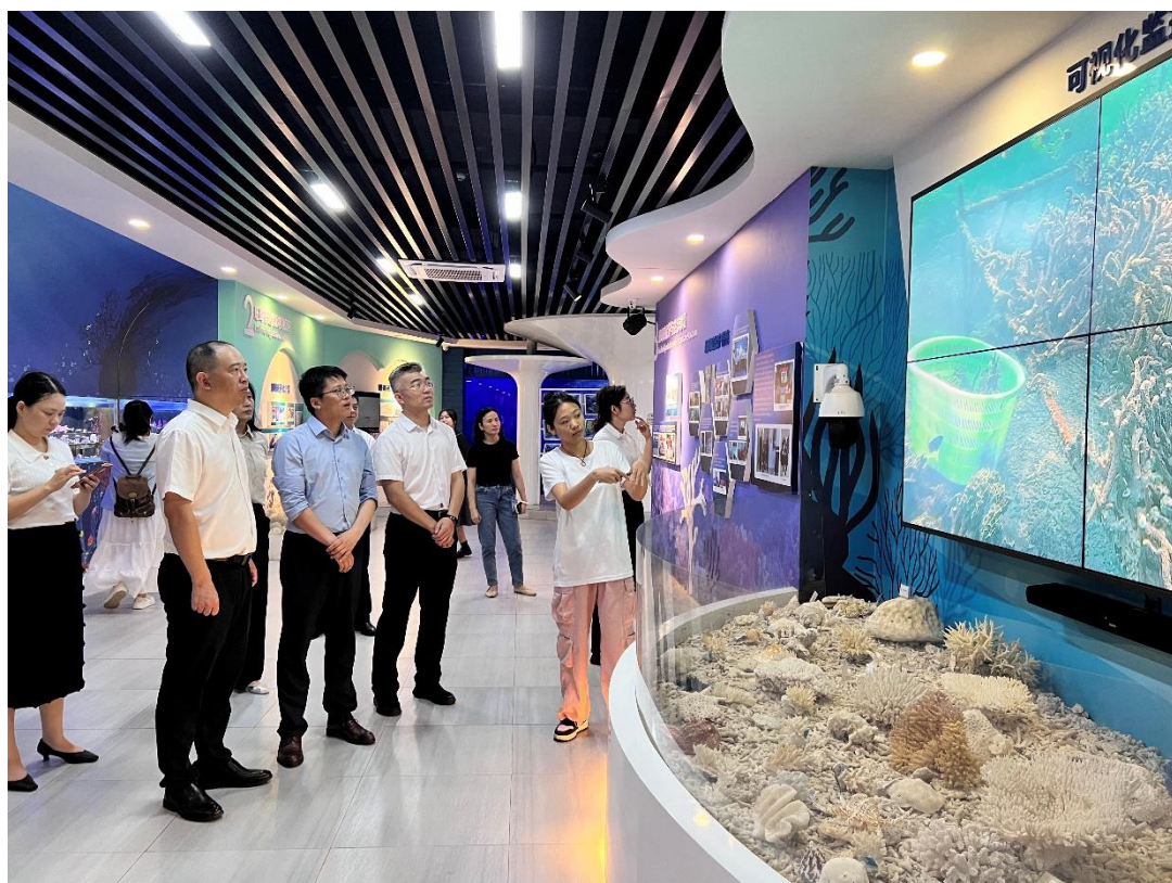
10月17日涠洲人民法庭领导带队参观珊瑚馆